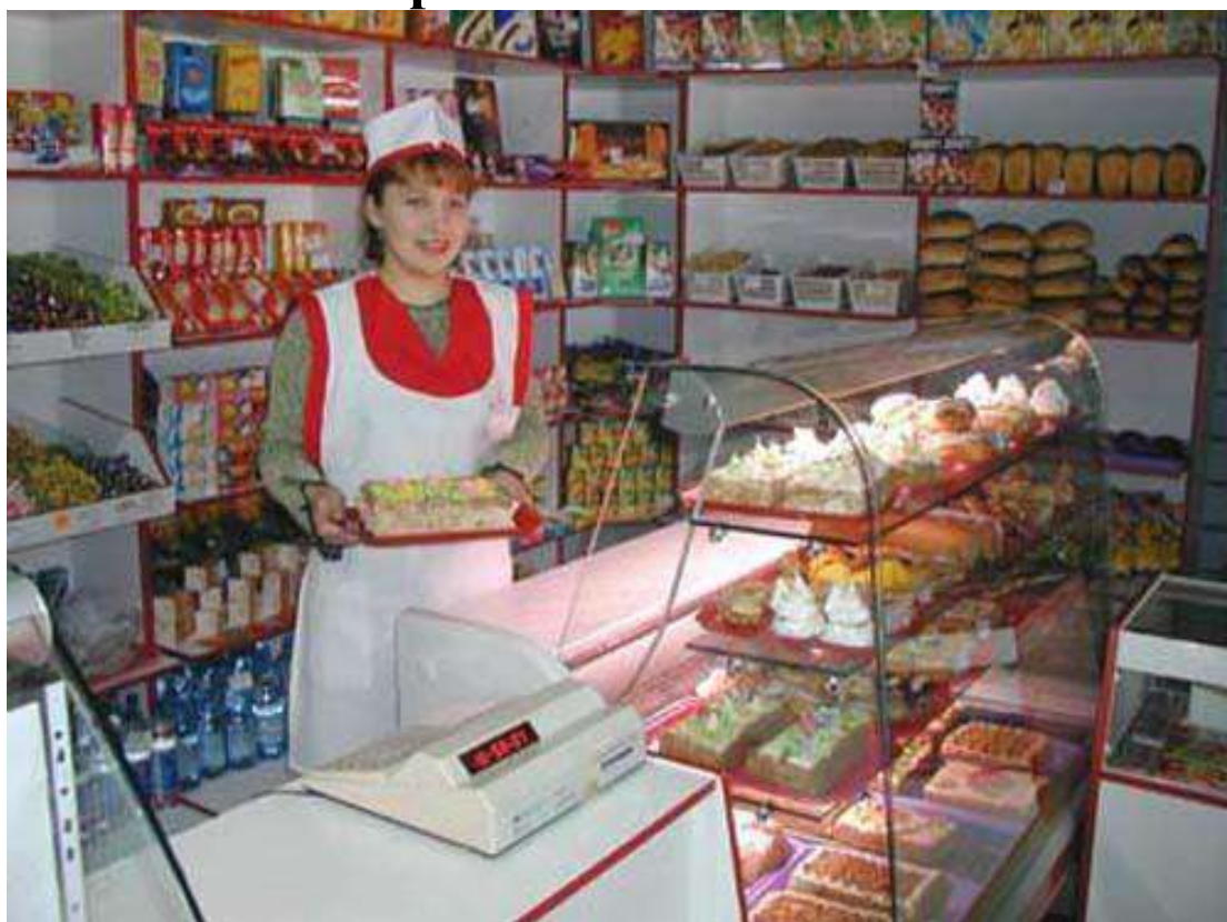
В магазине работает продавец,