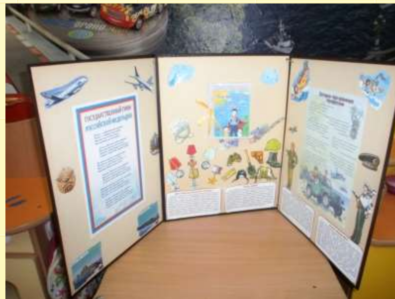
Лэпбук «23 февраля»