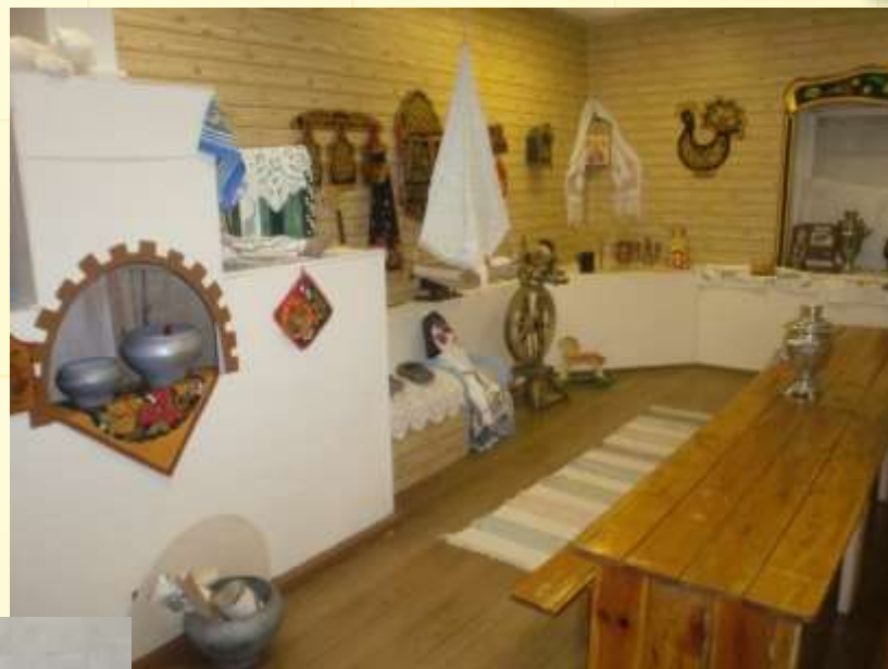
Музей «Русская горница»