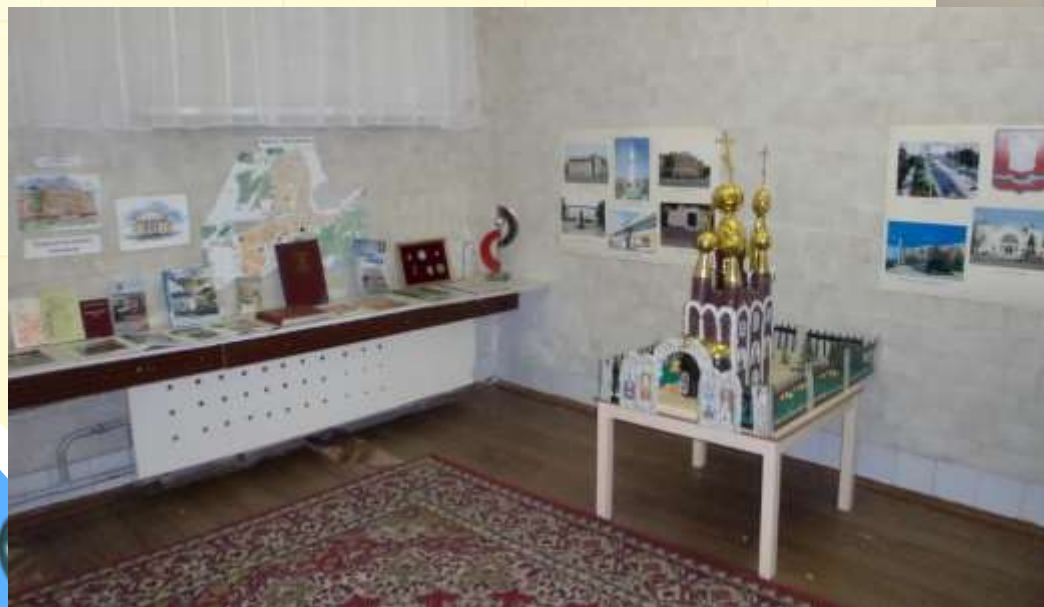
Музей «Наш город»