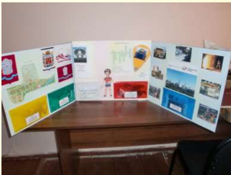
Лэпбук «Наш город»